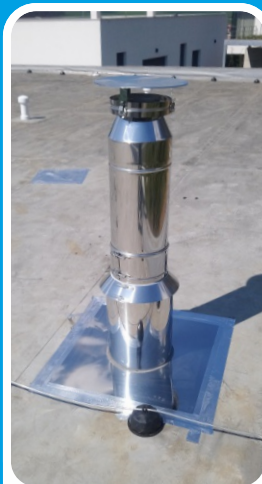
Odklápečí stříška s ochranou proti větru