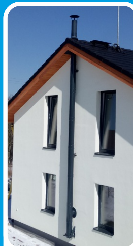
Lakovaný fasádní komín