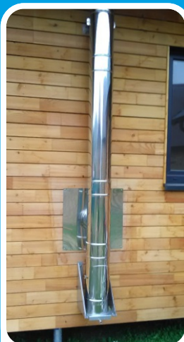
Na konzoli s kulatým vybíracím otv.