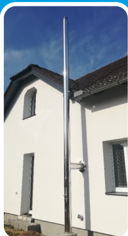
Cosmos založený na krátič. podstavci