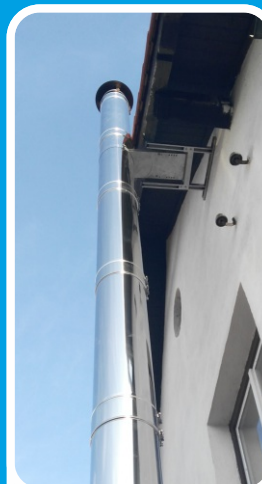
Kotvení s prodloužením stěn. držáků