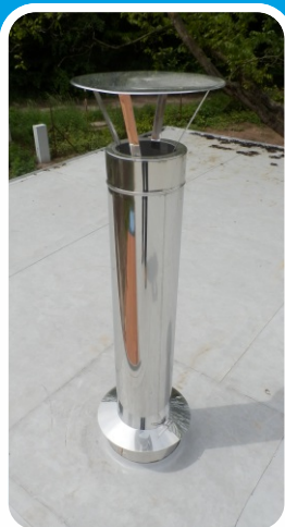
Ukončení se stříškou