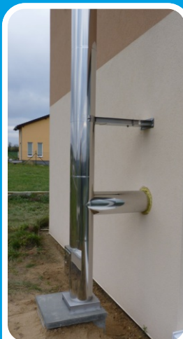
Cosmos založený na soklu