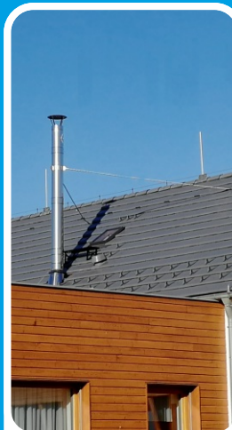
Kotvení pomocí teleskopických tyčí