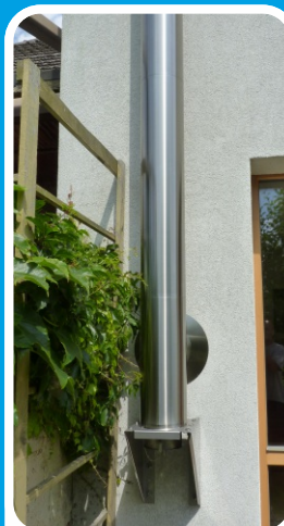
Cosmos na konzoli s čištěním shodem