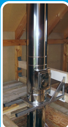
Na konzoli, s čistícím dílem