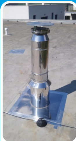
S plochým lemováním a odkláp. stříškou