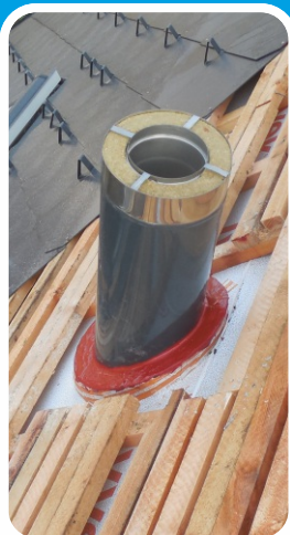
Parotěsný průstup v šikmé střeše