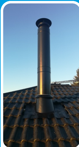
Lakovaná nadstřešní část