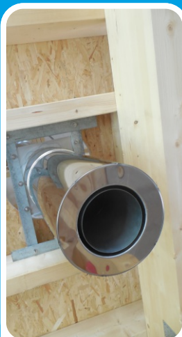
Detail roury s prodlouženou zděří