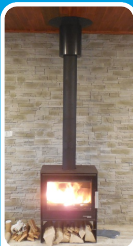
Lakovaná interiérová část