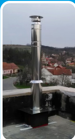
Parotěsný průstup v ploché střeše