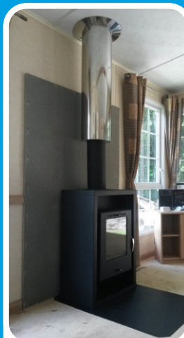
Dlouhá lesklá interiérová část