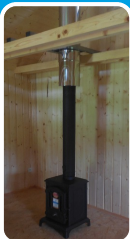
Založení na stropních trámech